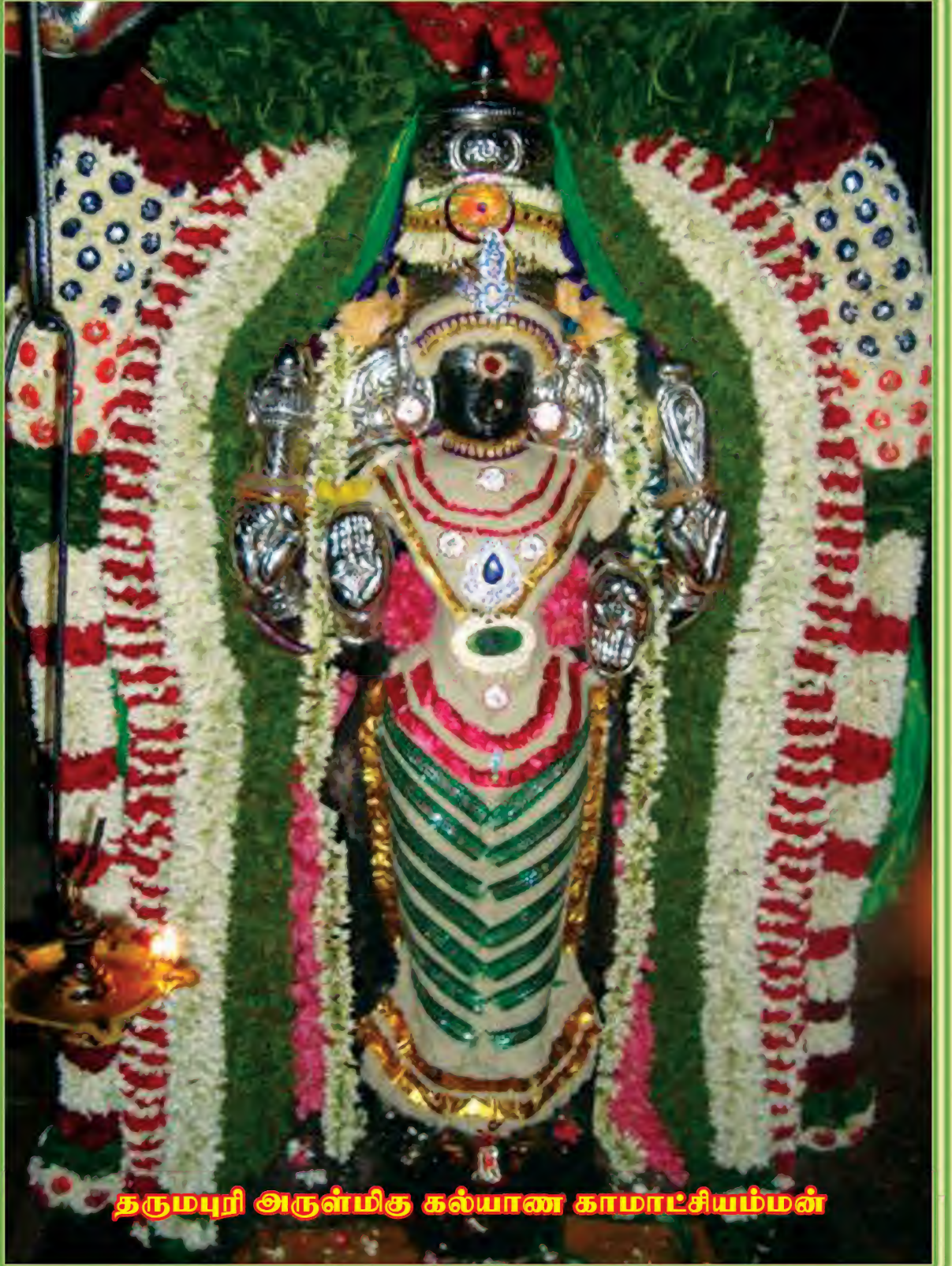
தருமபுரி அருள்மிகு கல்யாண காமாட்சியம்மன்